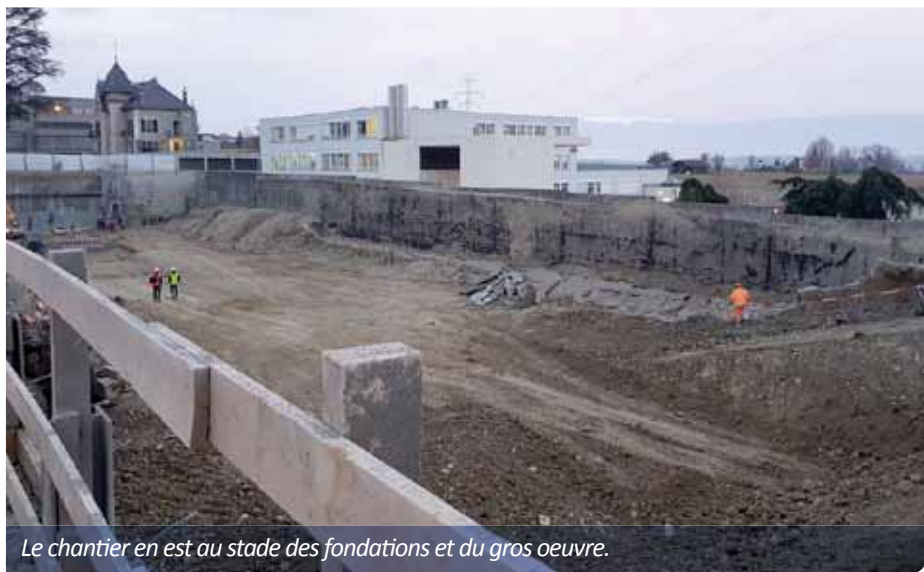
Le chantier en est au stade des fondations et du gros oeuvre.

Un nouveau chantier a été lancé, voici quelques mois, juste à côté du Centre de vie intergénérationnel. Il s'agit d'un projet immobilier et commercial comprenant la construction de 33 logements et d'une vaste surface commerciale au rez-de-chaussée, dans laquelle pourrait prendre place une crèche.