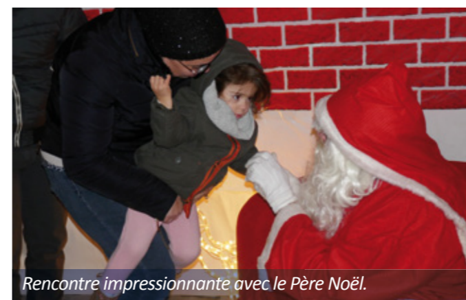
Rencontre impressionnante avec le Père Noël.

Davantage de photos sur www.perly-certoux.ch/fr/photos