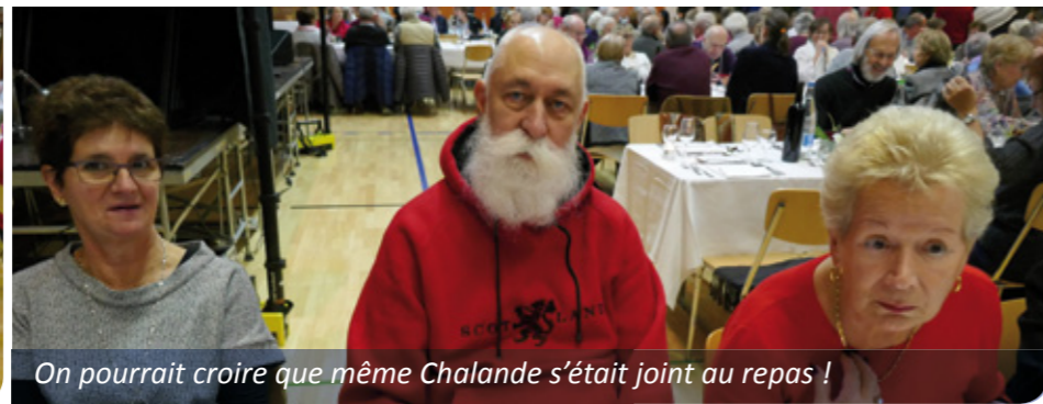
On pourrait croire que même Chalande s'était joint au repas !