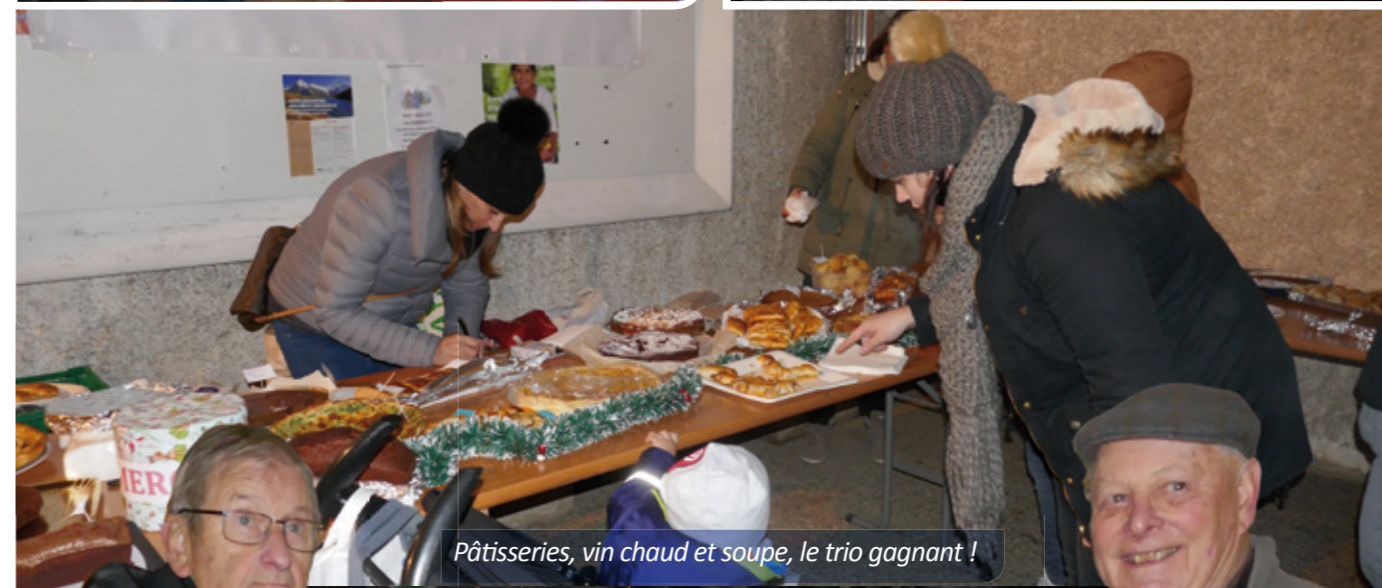
Pâtisseries, vin chaud et soupe, le trio gagnant !