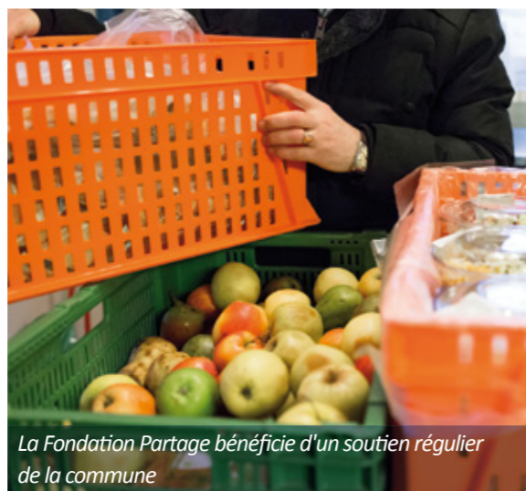
La Fondation Partage bénéficie d'un soutien régulier de la commune

Concernant les projets, la Commission réserve deux tiers de son budget à des projets dont les bénéficiaires sont situés sur le territoire genevois ou suisse et un tiers à des projets dont les bénéficiaires se situent à l'étranger. « Dans ce contexte, nous soutenons de manière récurrente deux institutions genevoises, la Fondation Partage et la Fondation Colis du Cœur dont les actions sont ciblées sur le territoire cantonal. Celles-ci ont reçu CHF 2'500.- chacune en 2018. »