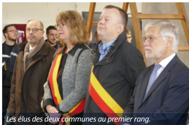
Les élus des deux communes au premier rang.

Une belle cérémonie suivie d'un apéritif convivial, comme il se doit !