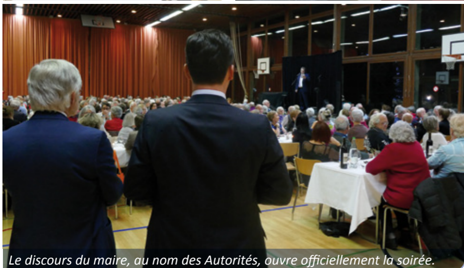
Le discours du maire, au nom des Autorités, ouvre officiellement la soirée.