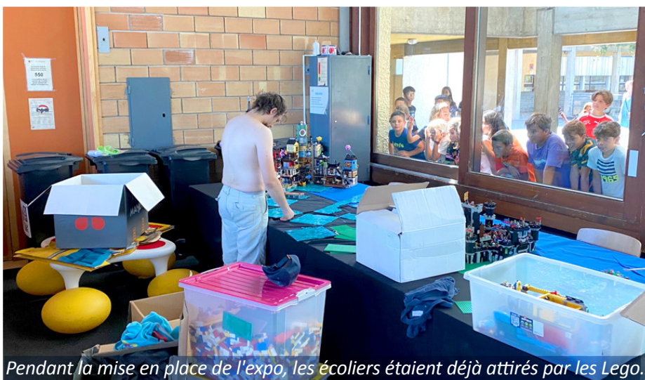
Pendant la mise en place de l'expo, les écoliers étaient déjà attirés par les Lego.

La legomania a fait le reste... Après l'implantation d'un magasin dédié à Lego sur la commune, la création de l'association et le succès de l'exposition (en attendant les suivantes !) confortent décidément Perly-Certoux comme la capitale genevoise du LEGO.