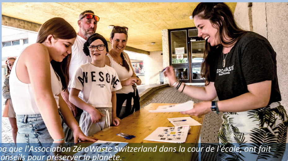
Tant Nouvelles Graines dans son Potatoa que l'Association ZeroWaste Switzerland dans la cour de l'école, ont fait bénéficier la population de leurs bons conseils pour préserver la planète.