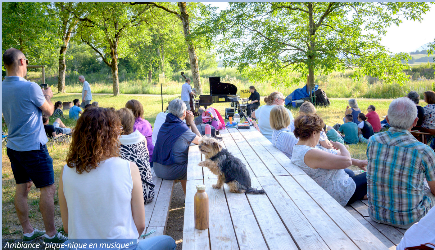
Ambiance "pique-nique en musique"