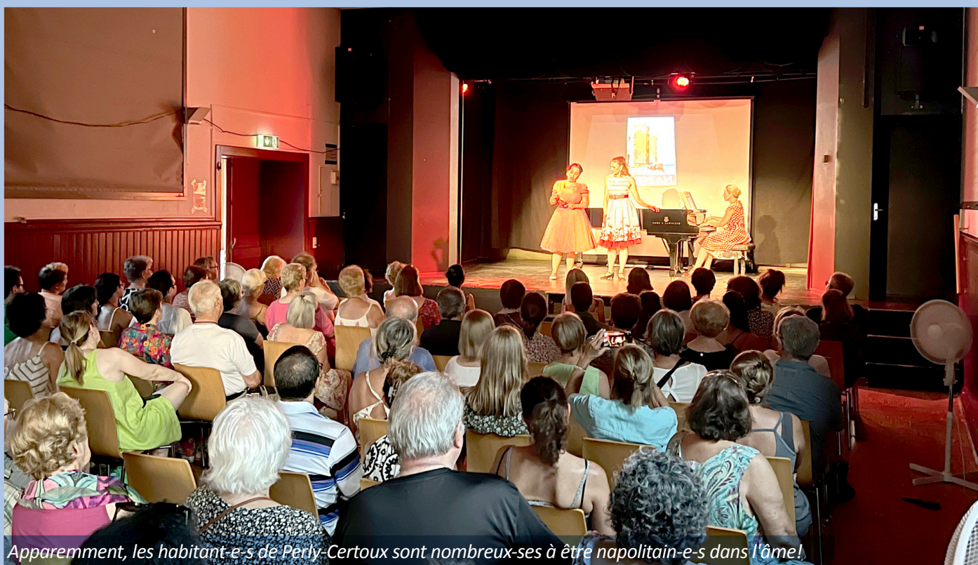
Apparemment, les habitant-e-s de Perly-Certoux sont nombreux-ses à être napolitain-e-s dans l'âme!