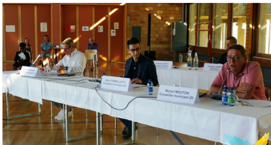
La composition détaillée de chaque commission et le PV des séances sont à lire sur www.perly-certoux.ch/Politique/Conseil municipal .