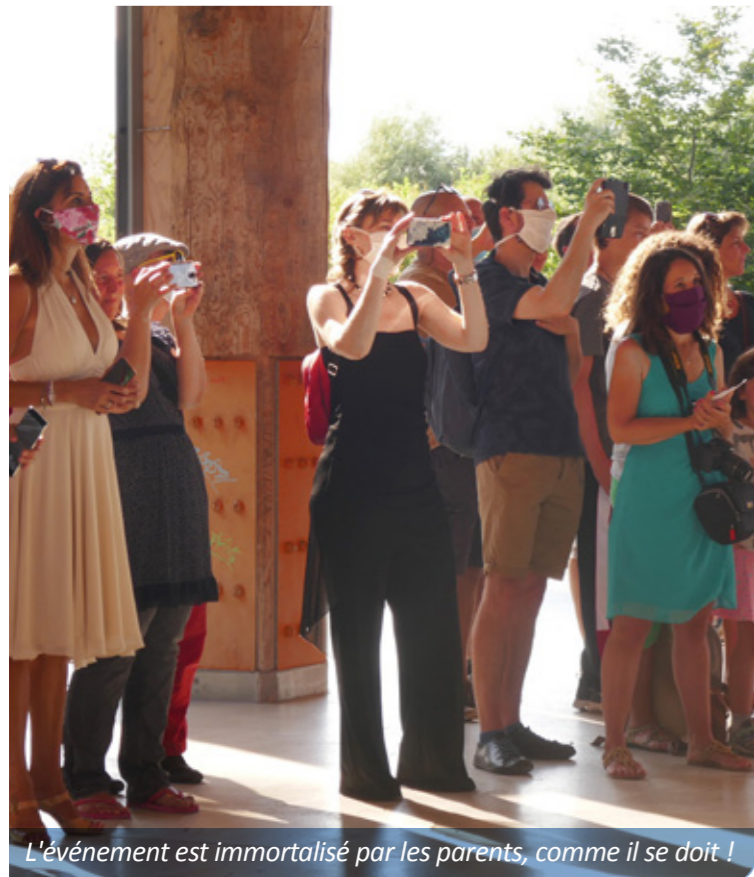
L'événement est immortalisé par les parents, comme il se doit !