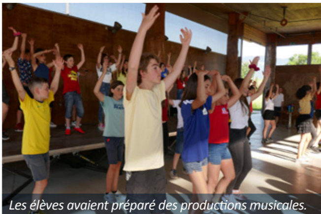
Les élèves avaient préparé des productions musicales.