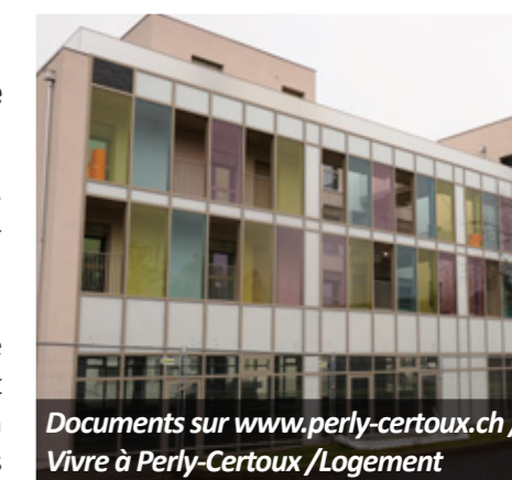
Documents sur www.perly-certoux.ch / Vivre à Perly-Certoux / Logement

L'entrée dans les logements est conditionnée à l'autorisation de mise en location de l'Office Cantonal du Logement et de la Planification Foncière (OCLPF) dont la décision peut prendre