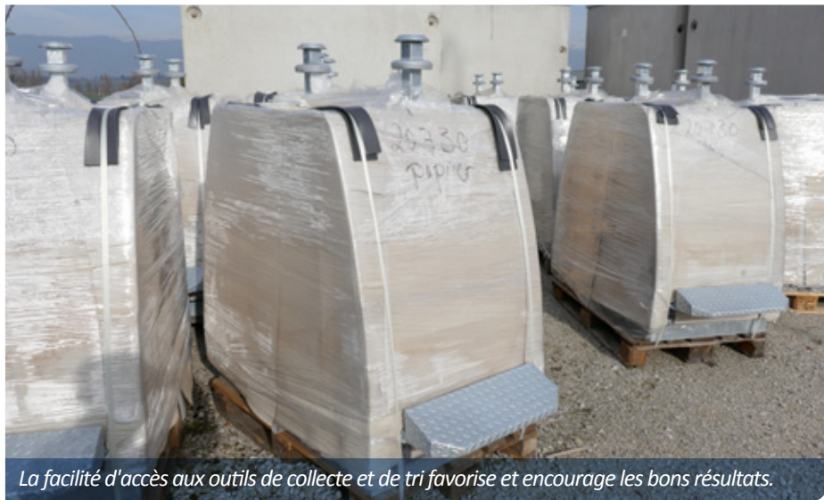
La facilité d'accès aux outils de collecte et de tri favorise et encourage les bons résultats.

Avec un taux de déchets recyclables à près de 53% pour l'année 2017, la commune de Perly-Certoux a dépassé le taux de 50% espéré par le canton et figure ainsi parmi les meilleurs élèves en matière de tri des déchets. Mais ce qui est particulièrement à relever est que parallèlement à l'accroissement de ce taux de recyclage ou de tri, la quantité de déchets par habitant s'est réduite.