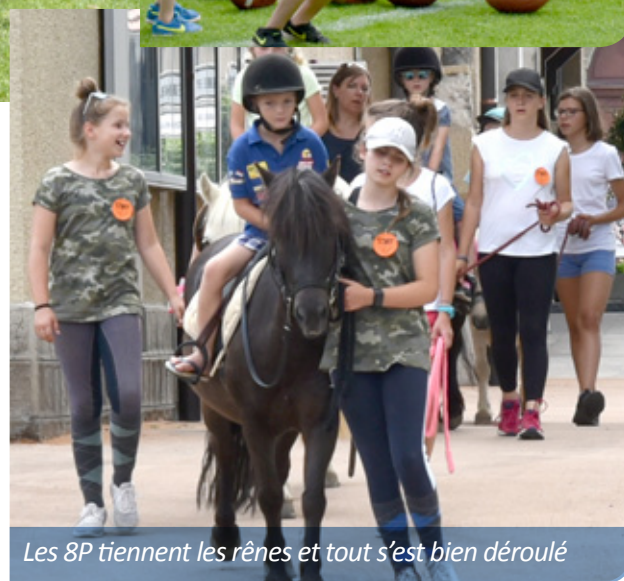
Les 8P tiennent les rênes et tout s'est bien déroulé