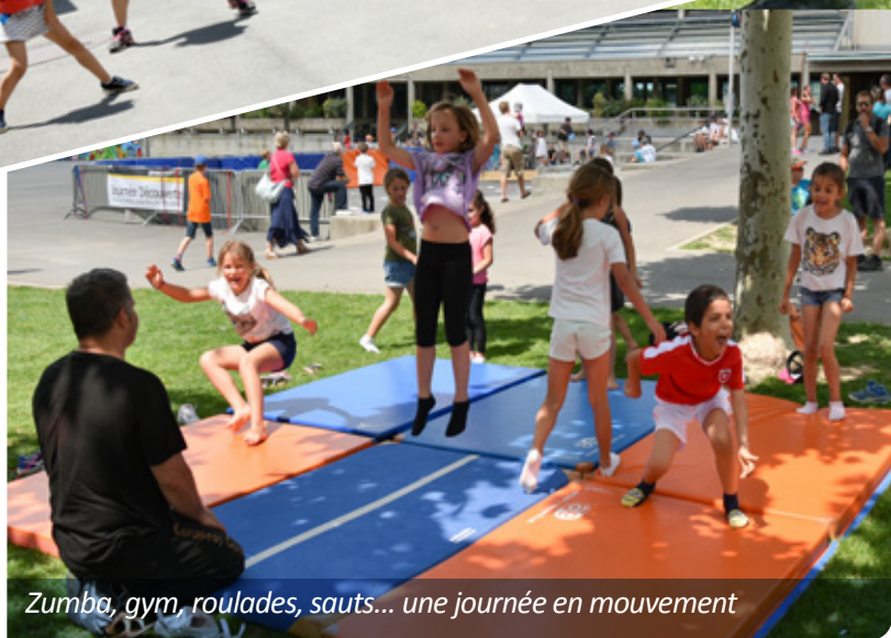
Zumba, gym, roulades, sauts... une journée en mouvement