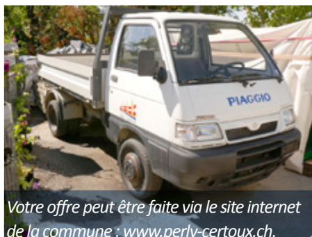
Votre offre peut être faite via le site internet de la commune : www.perly-certoux.ch .

hangar de la Voirie, chemin des Vignes, à Perly. Le véhicule n'étant plus immatriculé, il ne pourra être testé sur route.