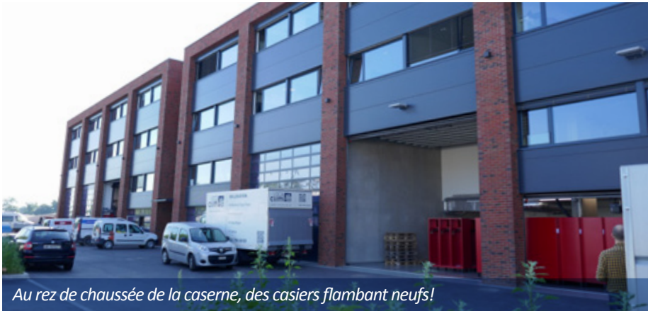
Au rez de chaussée de la caserne, des casiers flambant neufs!

La Compagnie et l'Amicale des sapeurs-pompiers de Perly-Certoux logeront dès septembre dans une caserne neuve, construite au chemin des Epinglis, sur la commune de Bardonnex. Elles partageront l'espace avec leurs homologues de cette dernière commune. Visite avant l'installation définitive.