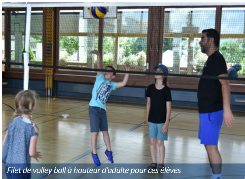
Filet de volley ball à hauteur d'adulte pour ces élèves