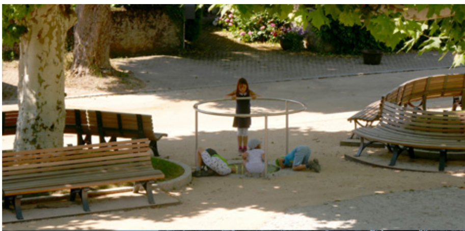
Le nouvel aménagement fait la joie des enfants. Ci-dessous, la fontaine à son ancien emplacement

Les anciens habitants de la commune se souviennent sans doute que la fontaine de la place dite de la Mairie n'a pas toujours eu son emplacement actuel.