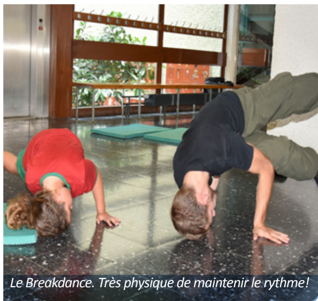
Le Breakdance. Très physique de maintenir le rythme!