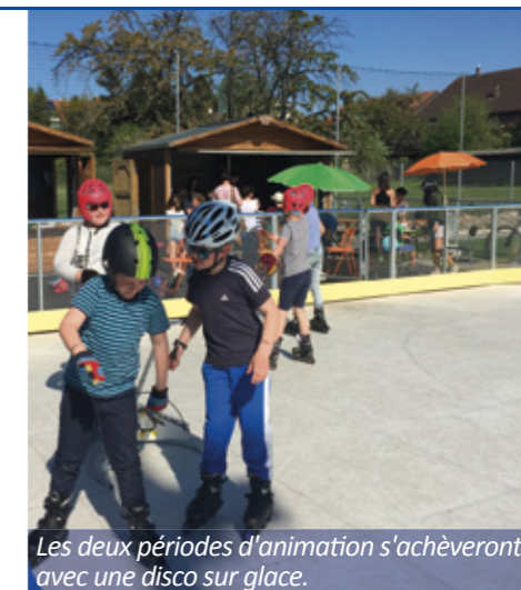
Les deux périodes d'animation s'achèveront avec une disco sur glace.

Pour les habitants de Certoux, qui souhaitent trier leurs déchets de cuisine, deux containers de récolte sont à disposition à la déchetterie communale. Mais rassurez-vous, compte tenu du succès rencontré lors des deux premières étapes de mise en œuvre à Perly, une offre complémentaire à Certoux est envisagée également pour la collecte des déchets de cuisine !