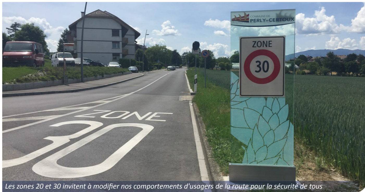
Les zones 20 et 30 invitent à modifier nos comportements d'usagers de la route pour la sécurité de tous

Avec la fin des travaux routiers dans les villages de Perly et de Certoux, des Zones 20 et 30 sont entrées en vigueur dans notre commune. Il y a encore peu de temps les routes étaient envisagées comme un espace principalement réservé aux véhicules à moteur. Les nouvelles Zones 20 et 30 permettent de réduire le trafic de transit, de diminuer le bruit et la pollution, et d'améliorer la sécurité des déplacements. Les aménagements réalisés valorisent en outre les espaces publics et apportent un caractère plus humain à nos routes et chemins.