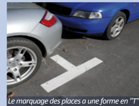
Le marquage des places a une forme en "T".

Les aménagements réalisés ont permis d'augmenter l'offre de stationnement et les habitants ne sont pas perdants. A Certoux, le stationnement sauvage atteignait une cinquantaine de places. La nouvelle donne, après travaux, est de 61 places de stationnement autorisé.