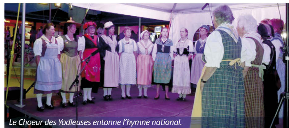
Le Chœur des Yodleuses entonne l'hymne national.