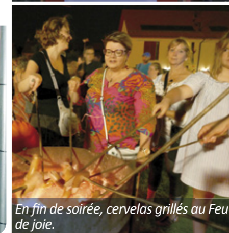
En fin de soirée, cervelas grillés au Feu de joie.