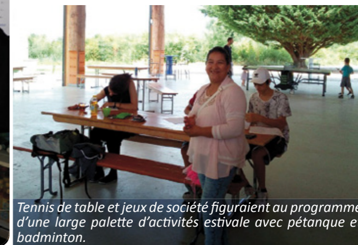
Tennis de table et jeux de société figuraient au programme d'une large palette d'activités estivale avec pétanque et badminton.