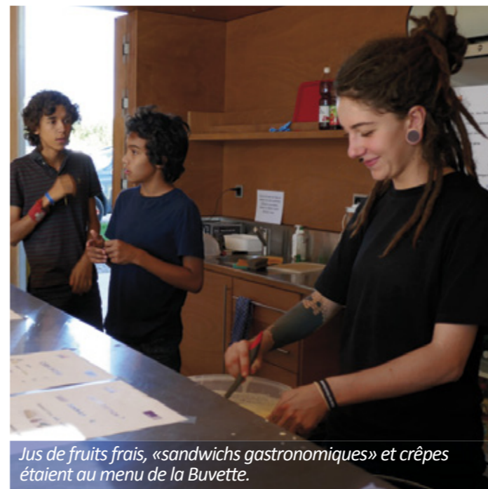
Jus de fruits frais, «sandwichs gastronomiques» et crêpes étaient au menu de la Buvette.