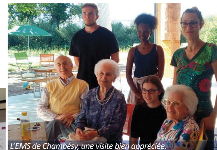
L'EMS de Chambésy, une visite bien appréciée.

La Buvette des jeunes au Couvert de Certoux devient l'événement couru de l'été ! Cette année, elle a très rapidement connu le succès, y compris hors des frontières communales. Un après-midi, des pensionnaires d'un EMS de Chambésy sont venus prendre le frais au bord de l'Aire. Une réalisation des jeunes de la commune, encadré par la FAS'e.