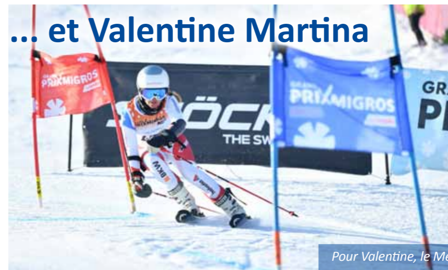
Pour Valentine, le Mérite n'attend pas le nombre des années !