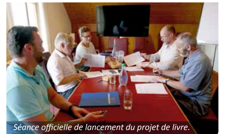
Séance officielle de lancement du projet de livre.

Le livre devrait paraître encore cette année du Bicentenaire + 1. En prélude aux festivités du Bicentenaire, en principe le 16 juin, une soirée "au coin du feu" permettra à la population d'entendre les historiens raconter leurs recherches sur Perly-Certoux. Tout-ménage à suivre !