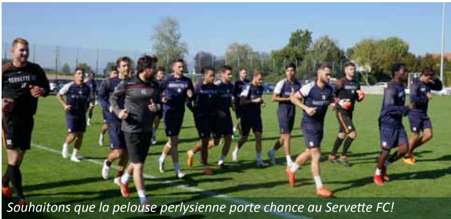
Souhaitons que la pelouse perlysiennne porte chance au Servette FC!

La première équipe du Servette FC a trouvé provisoirement refuge pour ses entraînements à Perly, le terrain A, en herbe, répondait à tous les critères émis par l'Association suisse du football (ASF) pour un terrain d'entraînement de l'équipe.