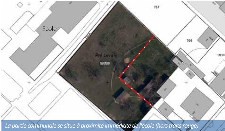
La partie communale se situe à proximité immédiate de l'école (hors traits rouge)

Le Conseil administratif a eu l'opportunité d'entrer en contact en 2017 avec les propriétaires d'une parcelle située à proximité immédiate de l'école, qu'ils voulaient vendre en partie. Ces discussions ont permis d'aboutir sur un accord des propriétaires de céder à la commune leur parcelle.