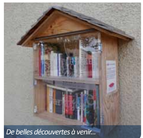
De belles découvertes à venir...