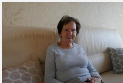
Félicitations à la lauréate !