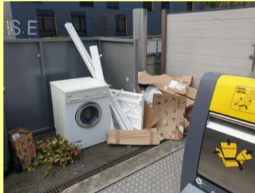
Rte de Base