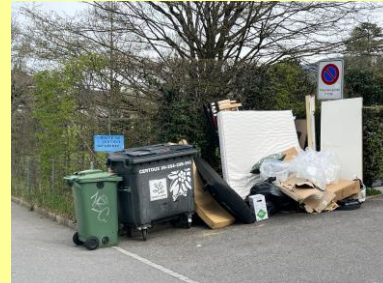
Rte de Certoux

La vue d'un objet encombrant incite très rapidement autrui à déposer de nouveaux objets encombrants au même endroit. Il est donc impératif que les objets destinés à la levée officielle des encombrants soient déposés la veille de la levée officielle (soit le 24 mai pour la prochaine levée du samedi 25 mai 2024). En dehors de cette date, les habitants peuvent profiter d'un débarras à la date de leur choix, offert par la commune, en contactant l'entreprise Chevalley au tél. 022 777 17 74 (mais pas moins de 15 jours avant la levée ordinaire).