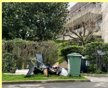
Rte des Ravières

Il y a dans la commune, trois espaces (au moins) qui sont susceptibles de devenir des déchèteries à ciel ouvert, si les habitants ne respectent pas le jour de levée des encombrants. Les voici (actuellement, tous ont été déblayés):