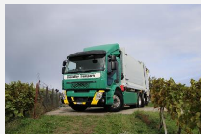
Le nouveau camion poubelle électrique qui circule dans la commune.