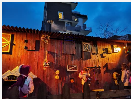
« Aglaglaaa » est une installation de rue de la Cie Progéniture.

Nichée au fin fond du grand Nord, « Aglaglaaa » est une vieille grange abandonnée remplie de petits secrets cachés, comme un cabinet de curiosités, ou un parcours de train fantôme. Cette vieille bâtisse délabrée renferme, bien sûr des histoires merveilleuses car au fil des siècles, les souvenirs y sont restés gravés... Mais derrière ses volets, des secrets effrayants vous attendent !